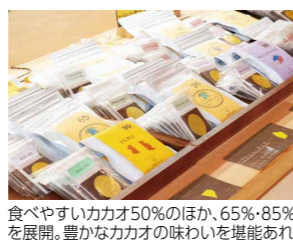
食べやすいカカオ50%のほか、65%-85%を展開。豊かなカカオの味わいを堪能あれ

セ ラ ヴ ィ chocolaterie & cafe C'EST LA VIE Chocolaterie & cafe