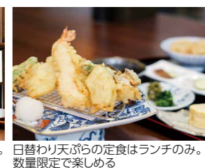
カウンター席が主体の落ち着いた店内。日替わり天ぷらの定食はランチのみ。席数に限りがあるので事前に連絡を