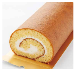
「ふわりとした食感が魅力。中央ロール1,500円」