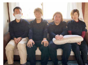
一人ひとりが多くの資格を所有。仲がよいのも最適なケアのためのポイント

利用者の希望に寄り添う"利用者ファースト"をモットーに、住み慣れた地域での快適な生活を叶えてくれる[煌]。スタッフ同士の連携も強く、迅速で丁寧なコミュニケーションによって、多角的な視点から利用者にとって最も良い支援の選択を心がけている。