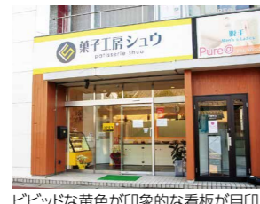
ビビッドな黄色が印象的な看板が目印